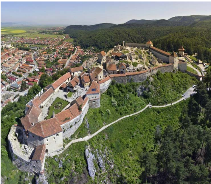
CIUDADELA DE RASNOV

Comenzaremos realizando un breve paseo por el casco histórico de Rasnov, observando el gigantesco cartel que, al igual que en Hollywood, muestra el nombre de la localidad.