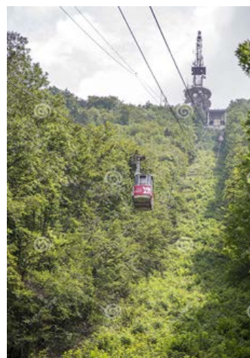
FUNICULAR MONTE TAMPA