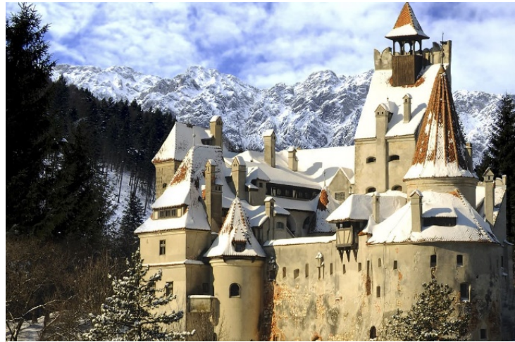
CASTILLO DE BRAN

Visita al castillo de Bran (1.213), conocido por el Castillo de Dracula , es una fortaleza medieval localizada en la actual Rumania, que goza de gran atractivo turístico por la creencia popular de que era la antigua residencia de Vlad Țepeș el Empalador.