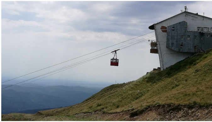
TELEFÉRICO DE SINAIA MONTE BUCEGI

Es posible el ascenso al teleférico hasta las cotas de 1.400 m. y 2.000 m. Esta actividad es voluntaria, pero según la situación meteorológica se puede ver magníficas vistas de las montañas en el valle del río Prahova, justo al este de las MONTAÑAS DE BUCEGI.