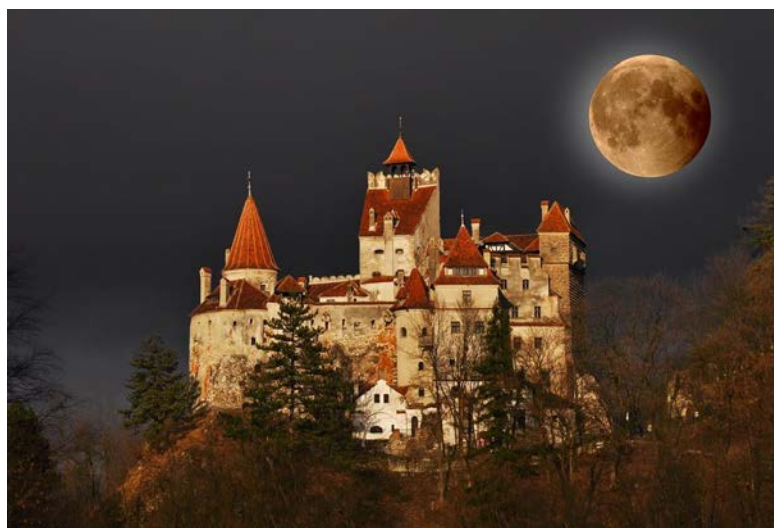
CASTILO DE PELES

El castillo de Peleş fue construido por iniciativa del primer rey de Rumania, Carol I, fuera del perímetro de la comuna de Podul Neagului, una localidad con una superficie de 24 km en 1874, año en que, por iniciativa del soberano, la comuna recibe el nombre de Sinaia. Un año después, en el centro del pueblo se construyen las primeras casas