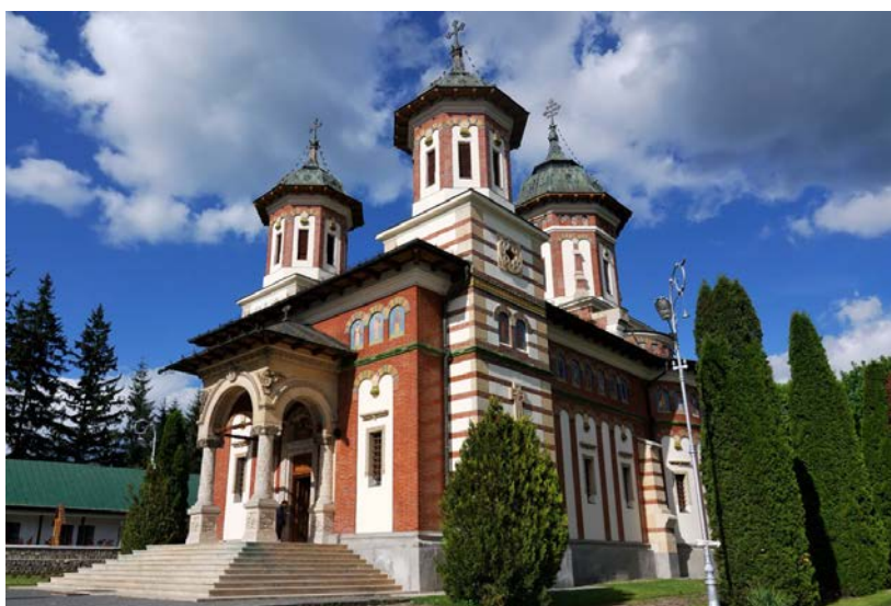
MONASTERIO DE SINAIA

El monasterio de Sinaia, localizado en Sinaia, distrito de Prahova, Rumanía, fue fundado por el príncipe Mihail Cantacuzino en 1695 y recibió este nombre por el gran monasterio de Santa Catalina en el monte Sinaí, Egipto. Allí podremos ver a los monjes que lo habitan, vestidos con sus ropas tradicionales, y podremos visitar algunas de sus estancias.